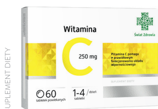
Witamina C 250 mg