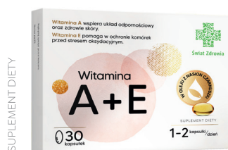
Witamina A + E