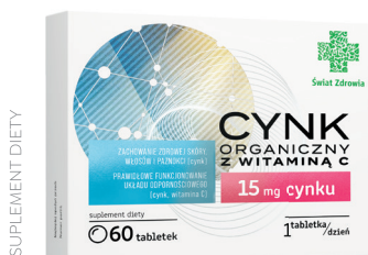
Cynk organiczny z witaminą C