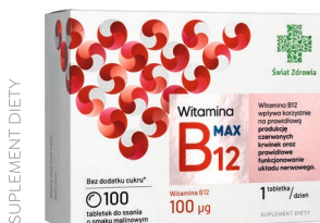
Witamina B12 Max