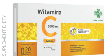
Witamina C 1000 mg Max