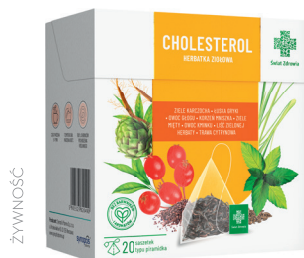
Cholesterol herbatka ziołowa