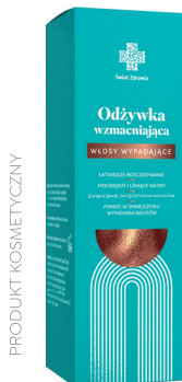
Odżywka wzmacniająca włosy wypadające