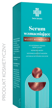
Serum wzmacniające włosy wypadające