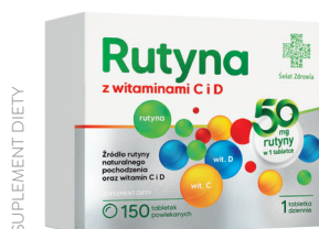
Rutyna z witaminami C i D