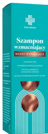
Szampon wzmacniający włosy wypadające