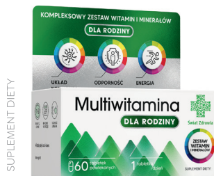
Multiwitamina dla rodziny