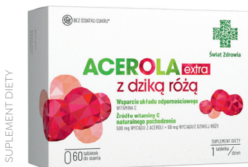
Acerola extra z dziką różą