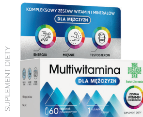
Multiwitamina dla mężczyzn