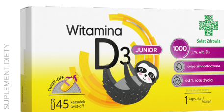
Witamina D3 Junior