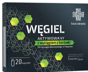
Węgiel aktywowany z wyciągiem z borówki