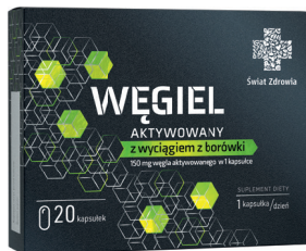
Węgiel aktywowany z wyciągiem z borówki