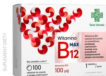
Witamina B12 Max