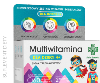
Multiwitamina dla dzieci 4+